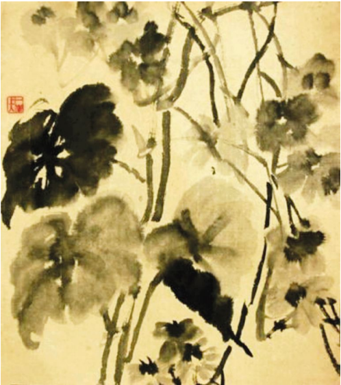
一峰上人绘《自分菰蒲淡渔翁》

程嗣立还是一位戏曲鉴赏家。乾隆七年(1743)正月某日雪天之后，园中开演《双簪记》，程嗣立邀请一些朋友共同欣赏。当晚明月高悬，树梢上悬挂花灯，灿若星辰，与雪月互相映照，再加悦耳的丝竹管弦和柔美的曲调唱腔，令人陶醉。