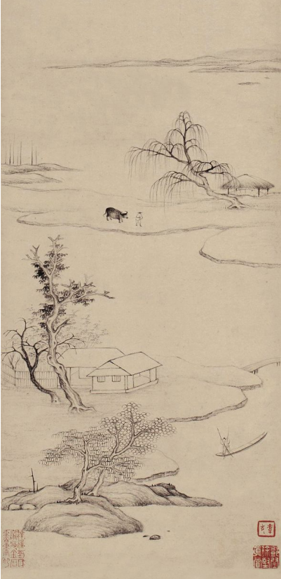
万寿祺所绘其河下《曝西草堂图》