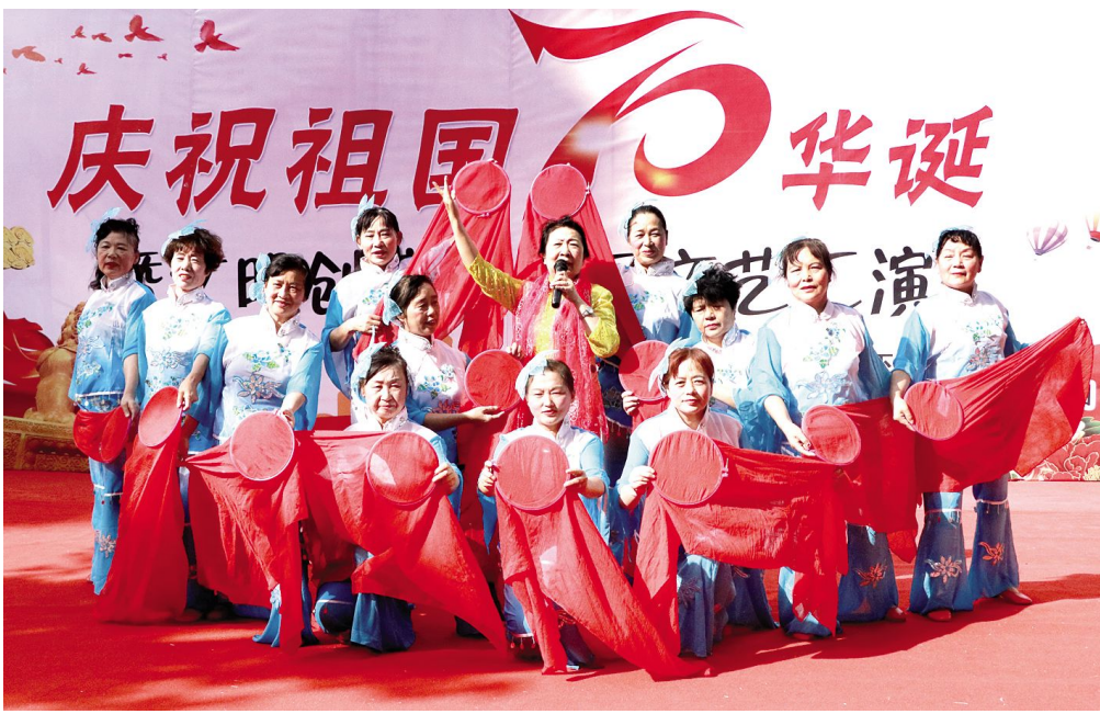
9月18日下午，河下街道新路村开展庆祝新中国成立70周年暨文明创建进社区活动。两个小时的演出，主题鲜明，内容丰富，给观众带来一场精彩的文化盛宴。钱玉莲 周小平 摄

“民情聊吧”坚持每月开展一次活动，参加人员数量不限、人员身份不限，按“说事、议事、办事、公示、回访”的工作流程解决问题。