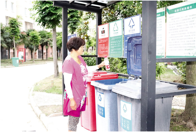
我区加快推进垃圾分类工作，在小区设置分类垃圾箱，张贴垃圾分类知识，不断增强居民垃圾分类意识。图为御庭园小区一位居民正在将空饮料瓶放入可回收垃圾箱中。

“社会化管理”是方案的关键词，方案一旦得到落实，狗患屡禁不绝的现象有望就此扭转。当然，社会化管理仍然离不开公权力的积极作为。如果，社区居民的自治迎来的是不文明养狗人的“硬杠”，或者因此成为社区无解的“内江”，则需要公安机关按照有关法律和养犬管理规定，对不文明养狗人依法严惩，以法治为群众的自治行为撑腰，让不文明养狗人威风扫地。