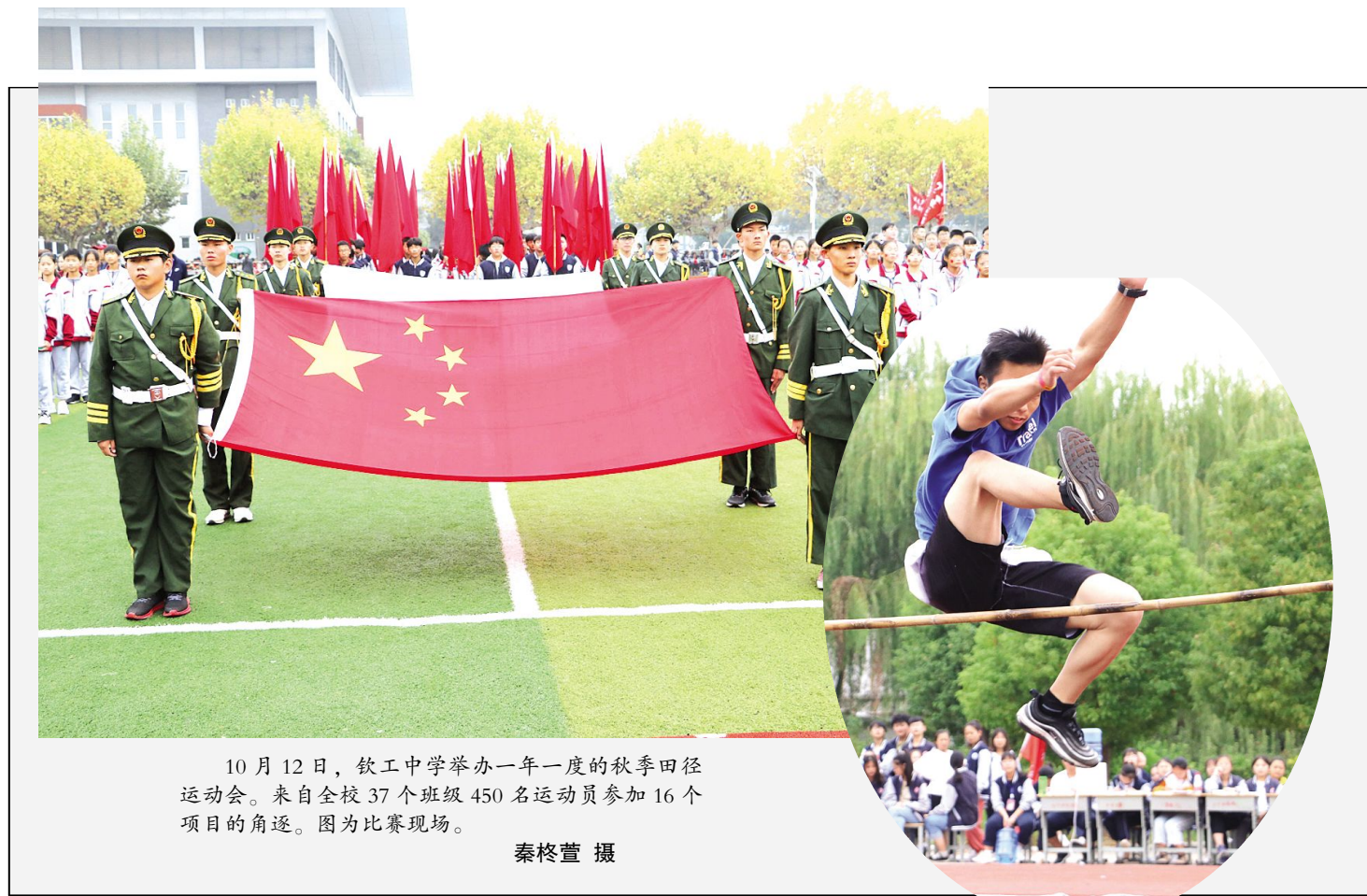
10月12日,软工中学举办一年一度的秋季田径运动会。来自全校37个班级450名运动员参加16个项目的角逐。图为比赛现场。

优质高效的帮办服务,为项目加快建设提供了支撑。目前,冷链及生鲜加工功能区已基本完成建设任务,物流仓储及配送的一号常温库、二号常温库正在紧张建设过程中,预计10月底竣工。供应链交易及综合服务、生活服务板块也启动建设。项目全部建成后,预计可实现商品配送及销售额超过100亿元,可吸纳1000人以上就业,将构建立足淮安、辐射华东、服务全国的现代化物流服务体系。