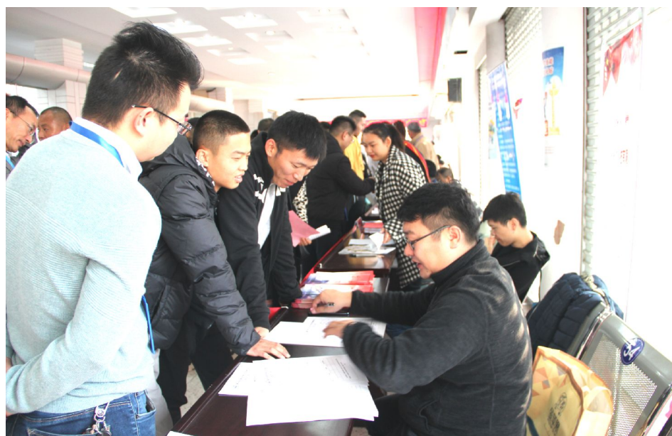
11月7日,“开启新征程,建功新时代”——淮安区2019年退役士兵就业专场招聘会在区人力资源市场举行。招聘会现场共设置60个展位,1068个就业岗位满足不同领域、不同学历的退役军人求职需求。招聘会共吸引450余人到场求职,达成意向121人。

该院根据市中院和本院关于“套路贷”虚假诉讼专项治理活动工作要求,经院党组研究决定,建立对涉“套路贷”虚假诉讼民间借贷“四类”重点案件排查、纠错领导分工包案、责任到人工作机制,即对疑似职业放贷人名录,公安机关已经查出“套路贷”违法犯罪案件,关联案件,当事人申诉、申请再审和群众举报投诉案件,分案到院领导及相关职能部门法官,组成合议庭专门排查,并形成复查报告。自“套路贷”虚假诉讼专项治理以来,该院党组提出线索排查、错案纠正工作永远在路上,该工作要求。按照院领导分案包干、责任到人工作机制,对排查发现的线索及时移送,并同步开展错案纠正工作。