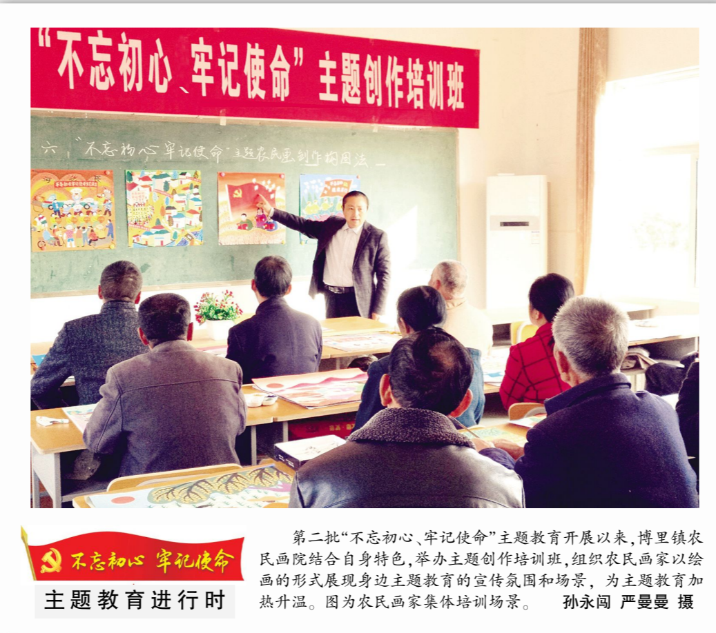
第二批“不忘初心、牢记使命”主题教育开展以来,博里镇农民画院结合自身特色,举办主题创作培训班,组织农民画家以绘画的形式展现身边主题教育的宣传氛围和场景,为主题教育加热升温。图为农民画家集体培训场景。孙永闯 严曼曼 摄

根据这位范经理提供的信息,记者又联系到瑞康花苑小区消防设施整改施工的负责人刘科长。在了解了大致情况后,刘科长表示他们会尽快与黄女士取得联系,到现场查看消防管道的布置情况。在不违反原则的情况下,尽可能给黄女士提供方便,满足她的要求。