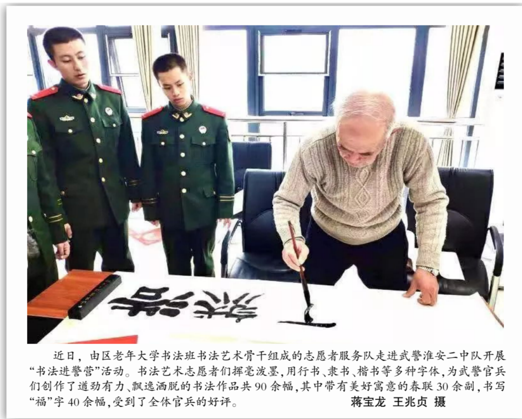
近日,由区老年大学书法班书法艺术骨干组成的志愿者服务队走进武警淮安二中队开展“书法进军营”活动。书法艺术志愿者们挥毫泼墨,用行书、隶书、楷书等多种字体,为武警官兵们创作了道劲有力、飘逸洒脱的书法作品共90余幅,其中带有美好寓意的春联30余副,书写“福”字40余幅,受到了全体官兵的好评。

法官说法:根据刑法规定,乘客在公共交通工具行驶过程中,抢夺方向盘、变速杆等操纵装置,殴打、拉拽驾驶人员,或者有其他妨害安全驾驶行为,危害公共安全,尚未造成严重后果的,应当以危险方法危害公共安全罪定罪处罚。在本案中,吴某的行为虽未造成严重后果,但重庆公交坠江事件历历在目,安全无小事,为了自己,也为了他人的安全着想,请做一名文明乘车人。