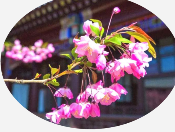
清明前夕，周恩来纪念馆内海棠盛开。树木繁花，犹如粉色的云彩，蕴含着盎然春意。周总理生前最爱海棠。如今，这里的海棠花开得美丽而深情。