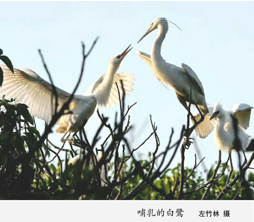
哺乳的白鹭 左竹林 摄