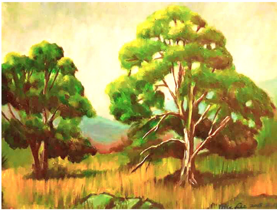
佳洛水涛声 李元亨作