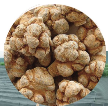
惠民生活馆 云南文山三七直销节

生活馆确保:所遴选的每一头三七,严格挑选,没有病三七、瘪三七,不抛光、不染色、不打蜡。为市民提供现场验货,避免以次充好;还可以现场打粉,更方便市民。