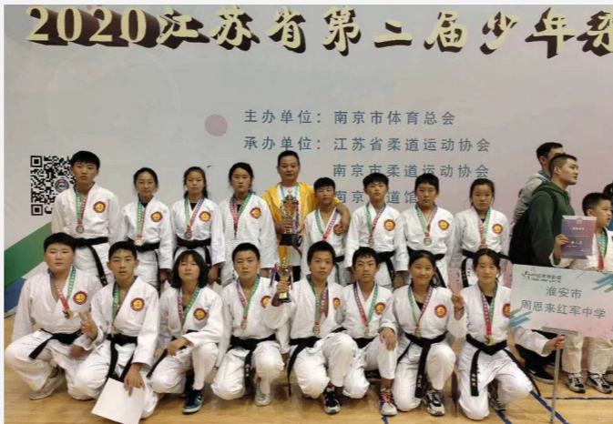
来红军中学勇夺8枚金牌,4枚银牌,3枚铜牌。本次比赛与首届相比,参赛选手多,竞技水平高,竞争异常激烈。比赛中,我区参赛选手充分发

挥自身优势,英勇善战,稳扎稳打,敢搏敢拼,在赢得胜利的同时也赢得了对手的尊重和业内同行的啧啧称赞。