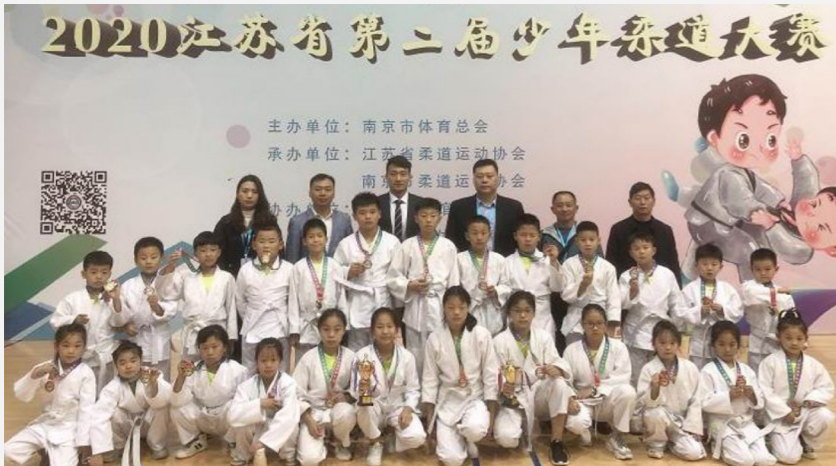
融媒体记者 刘蕾 通讯员 项生威 高军 10月17日-18日,2020年江苏省第二届少年柔道大赛在南通举行,来自全省30多支代表队近400名选手参加比赛。我区中小学代表队斩获佳绩,其中淮安经济开发区实验小学勇夺11枚金牌,9枚银牌,5枚铜牌。周恩