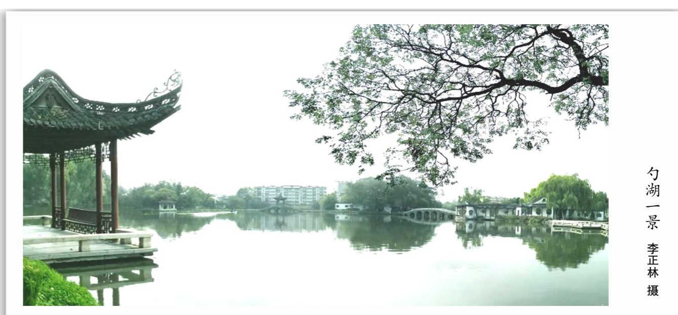
勺湖一景