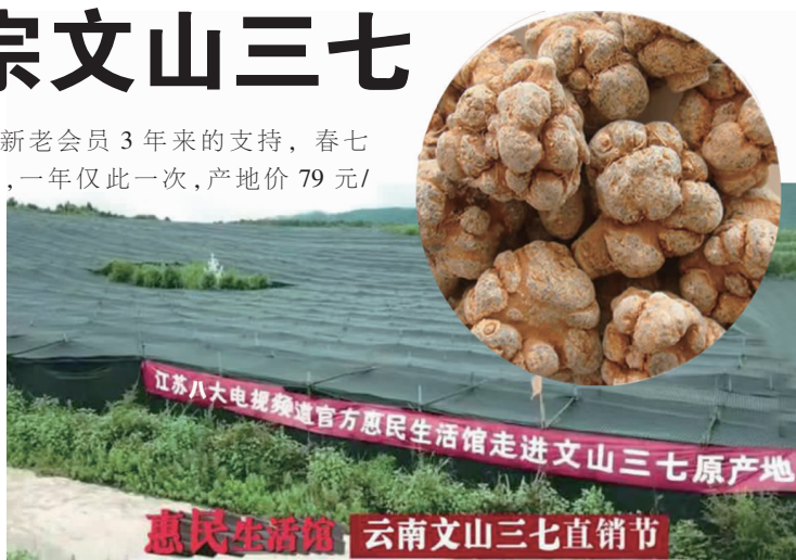
惠民生活馆,云南文山三七直销节

生活馆确保:所遴选的每一头三七,严格挑选,没有病三七、瘪三七,不抛光、不染色、不打蜡。为市民提供现场验货,避免以次充好;还可以现场打粉,更方便市民。