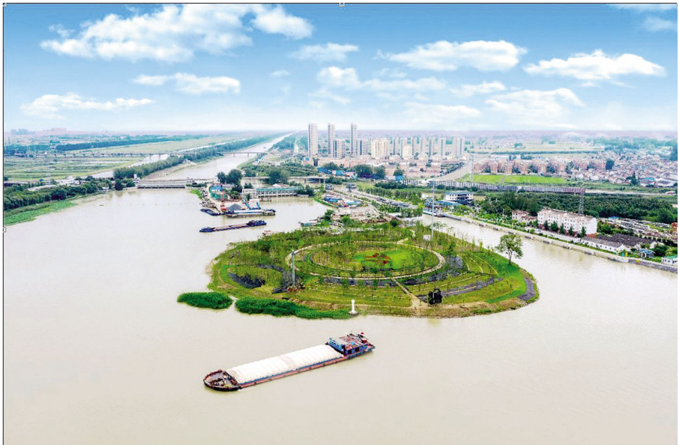
大运河畔起灯塔,照亮运河夜行人

为让京杭运河古老的河道更绿色、更现代,我区以流域环境整治为手段,以高品质项目建设为依托,全力打造京杭运河绿色现代航运示范区先导段,实现“黄金水道”颜值内涵双提升。