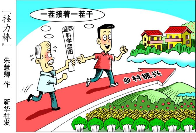
朱慧卿 作

耕耘的过程就是对人生酸甜苦辣的品味。人生当中,要有“钓胜于鱼”的心态,放下对结果的偏执,将精力聚焦于做事的过程中,享受过程的充实与快乐。只计做事,并将其做到极致,长期坚持不懈,其功必自成。