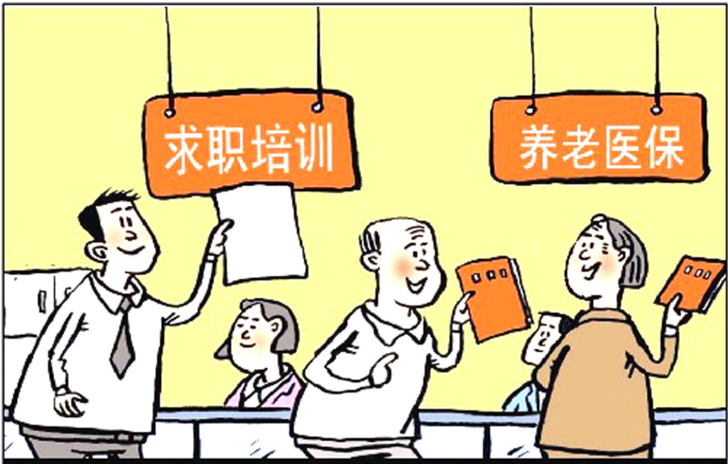
保障民生之本 毕传国 作

疫情防控形势严峻复杂,应急处置能力这个“标配”需要强化。镇卫生院、村卫生室等基层医疗机构应发挥探头作用,加强对发热、干咳、咽痛等呼吸道症状病例的监测上报,引导村民患病后及时规范就医,及时对发热病人进行筛查治疗,做到早发现、早诊断、早报告、早隔离。凡事预则立,不预则废。做好应急预案,完善物资、车辆、隔离场所等保障措施,一旦发生疫情,就能迅速响应、精准处置,有效遏制病毒传播,牢牢把握防控主动权,守护乡村大地的安宁。