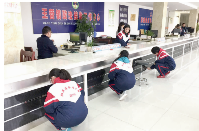
自己动手，绿色环保