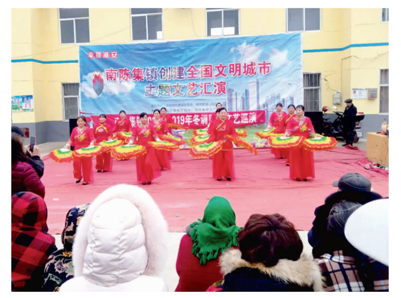
连日来,南陈集镇以“党员冬训、文明创建、文化下乡”为主题的宣传活动如火如荼。图为南陈集镇文艺宣传队开展村行文艺演出。