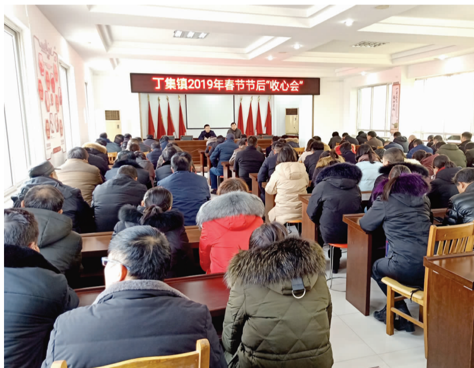
日前,丁集镇召开节后工作会议,要求镇村干部严格遵守工作纪律,迅速投入到工作状态。 ■ 通讯员 路遥

《哭孝》通过一位老人去世前后的不幸遭遇,并通过儿媳的“哭”来体现“孝”,深刻地揭露了存在社会中的丑恶现象,教育人们要弘扬中华美德,自觉做到敬老爱亲。该小说故事跌宕起伏,诙谐幽默,结尾处更是发人深醒。