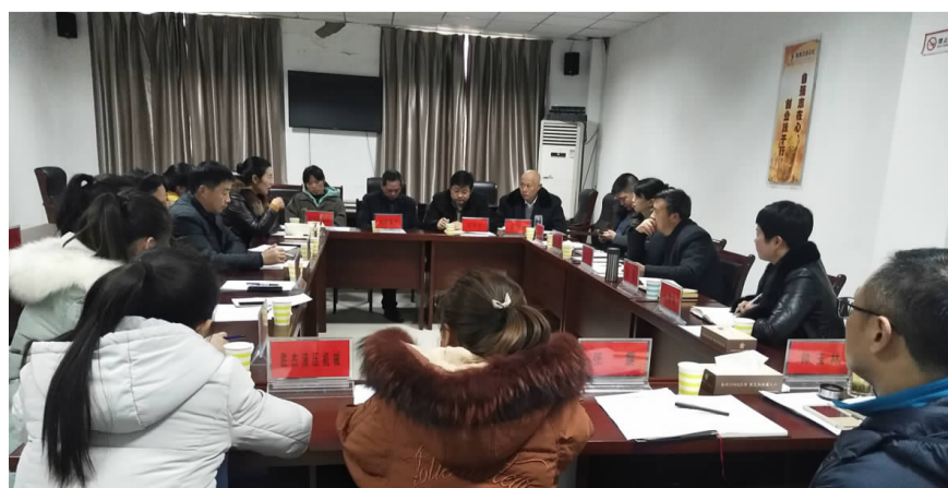
为了做好服务企业用工工作,区人社局于日前召开了服务企业调研座谈会,参加座谈会的有人社局相关负责人和 10 余家企业代表等。