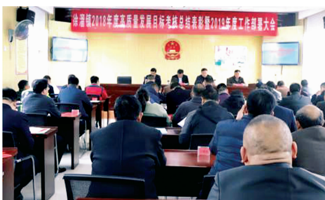
日前，徐溜镇召开2018年度高质量发展目标考核总结表彰暨2019年度工作部署大会。

联系人：朱先生 电话：0517-84937618 中共淮阴区委政法委员会 淮阴市淮阴区工业和信息化局 淮阴市淮阴区司法局 淮阴区新闻中心 淮阴市微型小说研究会 江苏白玫瑰糖业有限公司 2019年3月16日