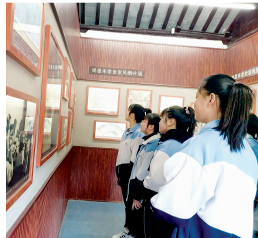
日前，区教师进修学校组织师生瞻仰周恩来纪念馆和故居，缅怀伟人功绩，感受伟人情怀，学习伟人精神。