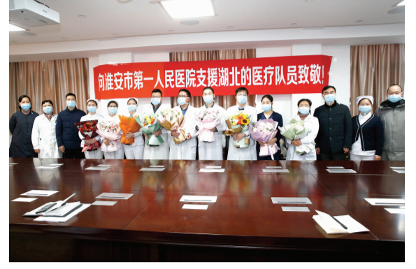
2020年1月27日，淮安市一院领导和部分职能部门人员为支援武汉的队员送行。

淮安市第一人民医院通过一系列优化和改进，全面提升了医疗服务水平，着重改善了群众看病就医感受，形成了良好的“平民医院”品牌效应，社会知名度和美誉度不断提升，呈现强劲的发展势头。近年来，医院先后获得全国文明单位、全国改革创新医院、全国卫生计生系统先进集体、中国和谐医患先锋、全国“五四”红旗团委、国家级青年文明号、2018亚洲医院管理大会“最佳临床服务项目”类卓越奖、2019博鳌健康界峰会第三季中国医院运营管理案例第一名等荣誉。2020年荣获全国医院质量管理案例奖一卓越奖。在江苏省卫健委公布《关于2018年度三级公立医院绩效考核结果的通报》，淮安市第一人民医院在参评的115家医院中排名第四，在全省三级综合公立医院处第一方阵。在全国三级公立医院绩效考核中名列第72位。