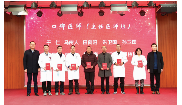
医院对2020年度门诊星级服务方面树立的标杆、先进典型等进行了表彰。