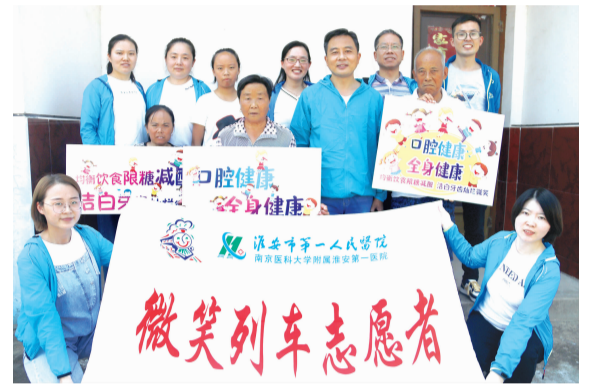
“微笑列车”志愿服务队荣获“中国第三届青年公益服务大赛银奖”。