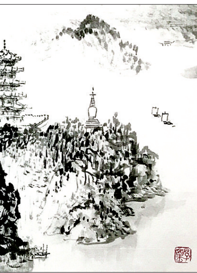
山河无恙 (国画) 王文明

家中媳妇，追求时尚，也有一台玫瑰色的“手持小电扇”，并在婆婆面前卖弄招摇，婆婆见了连说：“漂亮又时尚，方便又实用”，还说：“婀娜多姿，风情万种”，看了又看，试了又试，媳妇心领神会，第二天，就在网上订购了三把，分别送给婆婆和自己母亲，另外一把通过国际快递送给正在大洋彼岸读研的女儿，当女儿收到这个礼物后，即发微信给母亲“谢谢妈