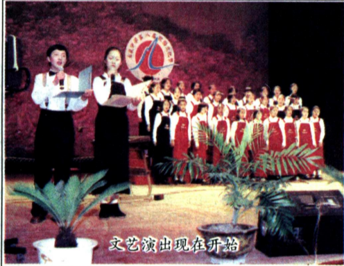
文艺演出现在开始