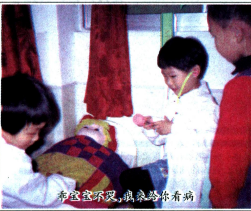
乖宝宝不哭，我来给你看病

质量在原有基础上有了很大的提高，曾先后获得区“学理论、促教改、创特色”推进素质教育好班组称号、区幼儿体育自编操汇演银奖、区幼儿园网页制作大赛二等奖、区女教工木兰剑比赛优胜奖、镇第二届运动会广播操、入场式金花奖等。另外，一大批青年教师脱颖而出；有区“园丁奖”获得者；区“三八”红旗手获得者；镇“优秀管理者”获得者；镇“优秀团干部”获得者等等。