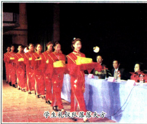
学生礼仪队落落大方