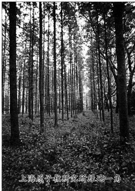
上海原子核研究所绿地一角

为了顺利地推进我区中小学校长职级制工作,区教育局在中小学校长职级制评审过程中彻底打破论资排辈的传统做法,注重强调学校管理者的能力、水平和工作实绩,实行群众参与、教代会测评和专家评审相结合的方法,力求将评审工作做到公开公平,将一批有能力、有水平、肯干、能干,办出学校特色的学校管理者推荐参加一级校长的评审。区教育局在推行中小学校长职级制时,将校长职级制与校长任期目标责任制、校长聘任制和校长年终考核奖励紧密结合,明确校长的责任、权利和义务,有效地强化中小学校长职级制的效能。 (龚文华)