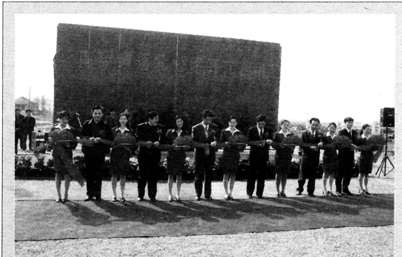
日前,南翔镇蕴北公路建设工程举行开工典礼。蕴北公路东起宝山区的陈广路,西至南翔镇新丰村,全长4.18公里,道路红线宽度35米,两侧各有10米的绿化带,总投资达4000多万元。建成后将成为南翔东北部主干道路。预计2003年元旦前工程将全面完成。

▲本区讯 为落实区政协委员关于“法律进三资企业”的提案,配合5月1日起《上海市劳动合同条例》的贯彻实施,进一步规范三资、民营企业合法经营,维护劳动者的合法权益,我区将从3月28日至4月28日组织开展“法律进企业”法制宣传月活动。(法轩)