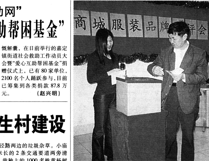
图片新闻 作为2002年上海国际服装文化节暨上海市第17届服装博览会嘉定分会场的嘉定商城,于日前开展了“我喜爱的服装品牌”消费者展评活动,投票参评者踊跃。图为在4月30日上午该商城举办的“我喜爱的服装品牌”消费者展评会抽奖活动中,区消费者协会的负责同志为消费者抽奖时的情景。

爱心,号召社会各界和广大市民来共同编织“社会救助网”。从倡议书发出以后短短1个月的时间,许多单位、党团员、干部、各界朋友、市民群众为爱心互助工作基金慷慨解囊,在日前举行的嘉定镇街道社会救助工作动员大会暨“爱心互助帮困基金”捐赠仪式上,已有80家单位,2100名个人踊跃参与,目前已筹集到各类捐款87.8万元。(赵兴明)