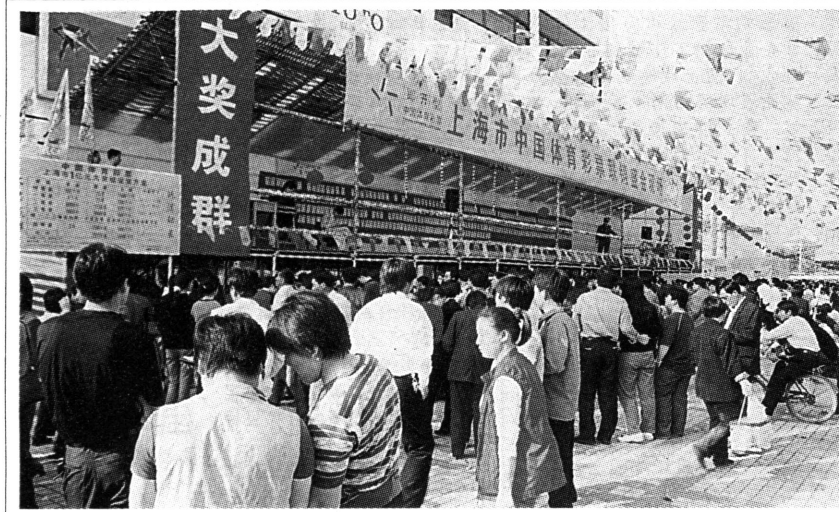
图片新闻 在“五一”黄金周期间,1亿元即开型体育彩票在我区销售,截止5月6日上午,已销售200多万元彩票。其中5月1日最为火爆,共售出彩票50多万元。100万元特等奖中奖者为闵行区的一位游客。

出租汽车驾驶员以方便群众、优质服务、树立品牌、提升嘉定形象为己任,受到了群众充分肯定。1年来,出租公司归还乘客遗失物品314件,其中贵重物品254件,救死扶伤事迹43起,收到各类表扬信70封,4位驾驶员受到了市表彰。1年来,为维护出租车运营秩序,有关部门共组织打击“黑车”行动304次,出动稽查人员4412人次,查扣无证营运车辆1000多辆,其中嘉定籍车辆570辆,有效地保护了区域性出租车的正常运营。(沈青)