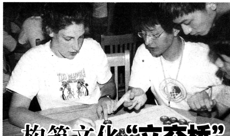
中美对奕 东西交流

长期坚持科技教育特色，全面实施素质教育方针也在整体上提高了嘉定一中的办学水平，在2001届、2002届的高考中，嘉定一中考生都有不菲的表现：上线率稳定在98%左右；重点大学上线率65%—70%；本科上线率为85%—87%。 谢锡林