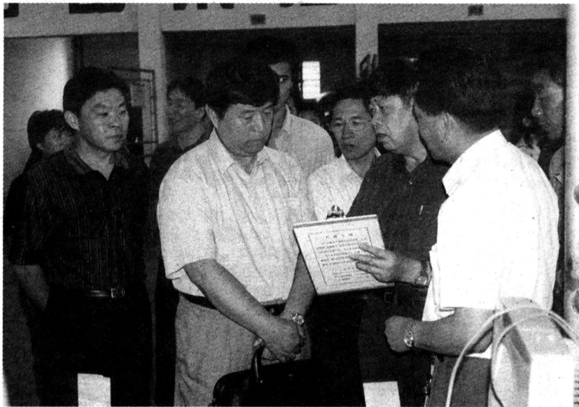
■王廷 摄影报道 本报讯 日前，由国家工商总局、国家经贸委、公安部等七个部、委、局组成的集贸市场专项整治联合检查组来到嘉定区检查。检查组对上海真新粮食交易市场运用先进检测设备检测大米、出售粮食统一开票等做法给予较高评价。检查组还对上海东方汽配城落实市场规范管理制度，积极发挥行业协会作用，增强企业自律意识，坚决堵住假冒伪劣汽车配件等工作给予充分肯定。

本报讯 江桥镇以创建上海市园林城区为契机，结合农业结构调整，大力推进绿化建设。 目前，江桥镇已完成工业区道路绿化7.9万平方米，居住区绿化1.5万平方米，企事业单位绿化15.6万平方米，火线村中心绿化广场4800平方米。同时，还将在上海西北物流江桥园区以南、封浜河以西、苏州河沿岸规划建设一个3000多亩的集休闲、生态旅游为一体的生态园林区，今年实施完成1000亩首期开发区域建设。 今年，江桥镇政府还确定人均每年增加5平方米绿化面积的指标，下达至各行政村，并纳入考核，计划今年全镇完成建设苗木林地1990亩。 吕健