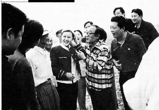
日前，上海文广新闻传媒集团、香港金日集团、嘉定菊园新区管委会、上海滑稽剧团主办的“保健康抗非典”农村曲艺专场在嘉定菊园新区六里村举行。 上海滑稽剧团演员的精彩演出博得了观众的热烈欢迎，2个小时的演出使观众既受到了教育也带来了欢迎。图为著名滑稽演员严顺开(右前二)、钱程(右前一)等与村民亲切交谈。

本报讯 6月22日，安亭镇第二届运动会召开。运动会共有72个单位、2400多名运动员参赛，除设有足球、篮球、乒乓球等传统的比赛项目外，还增设了拔河、吹气球、跳绳、呼拉圈等群众喜爱的项目，体现了重在参与、全民健身的运动宗旨。 图为运动会开幕式上运动员入场情景。