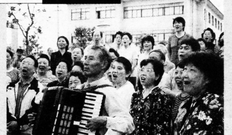
“祖国的春天多么美好，抗‘非典’战斗捷报报……”清晨，嘉定城区的一群歌唱爱好者聚集在博乐广场，歌唱我们的党，歌唱我们的祖国，欢呼抗击“非典”的胜利。图为市民正在歌唱自己创作的歌曲。