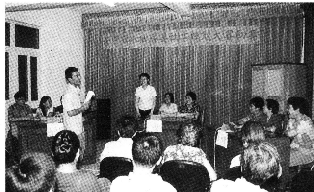
日前，由嘉定区社区建设领导小组主办的嘉定区社区工作者技能大赛在全区拉开序幕。图为安亭镇组织社区居委会进行社工技能大赛初赛现场。