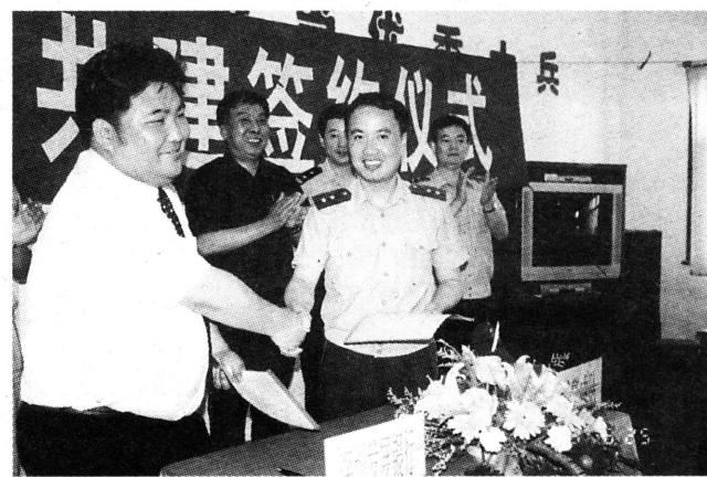
日前，深圳发展银行嘉定支行与武警中队举行共建签约仪式，并向部队赠送了4台电脑。图为双方签约时的情景。