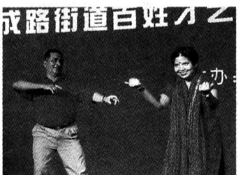
图为充满异国风情的“澎加比舞”。

据悉，新成路街道“百姓才艺大展示”系列活动，从8月开始至10月结束，将通过群众体育、书画、时装表演、手工制作等百姓才艺展示，丰富社区居民文化生活，营造温馨家园。