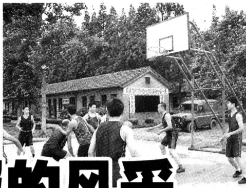
某驻区部队 篮球对抗赛