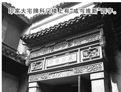
印家大宅牌科门楼上有“咸与维新”四字。

历史建筑承载的历史文化价值,是对其进行市场化运作的基础。区文物管理委员会的一位负责人建议,可对历史建筑进行分类管理。如具有特别历史文物价值或科学、艺术价值的特级历史建筑,要严格禁止转让,由政府部门出资修缮和保护;其他建筑在允许转让的同时,政府主管部门同购买这些建筑的物业所有人签订“保护责任”协议,详细规定修缮和使用的程序与内容,严格实行监管。在这个前提下,允许新的物业所有人把这些历史建筑引入旅游业或其他第三产业,以努力培育历史建筑的内在活力,构建长久保护机制。这样不仅能有效分担政府财政负担,承担大规模历史建筑保护所需资金,并尽快形成解决历史建筑保护与经济社会发展相协调的治本之策。