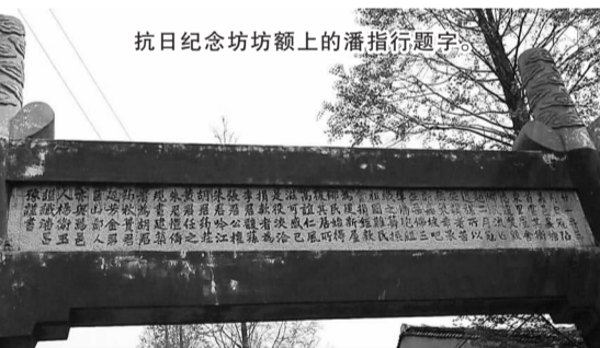
抗日纪念坊额上的潘指行题字。