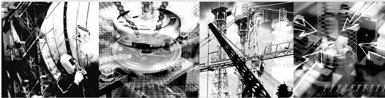
■ 通讯员 李宁 于俊丽 顾昊 宋婷 乔莉 记者 沈青

进入夏季,按照上海市委、市政府“坚持限电不拉电、确保市民生活用电不受影响、确保重点企业生产需要、确保城市生产生活正常有序”的要求,全区共有100多家企业实行让电,1100多家企业调整厂休日错开用电高峰时段安排工作,1400多家企业从7月11日至8月28日轮休一周……为确保今夏居民用电,尽可能减小企业经济损失,不少政府职能部门统筹全局,早安排、细打算,多方面为企业着想。在这过程中,更有一些企业顾全大局,积极调整内部生产和运行节奏,主动要求参与让电、轮休,无条件、无怨言地服从安排,令人感动。