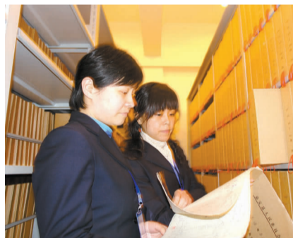
工作人员正在整理馆藏档案