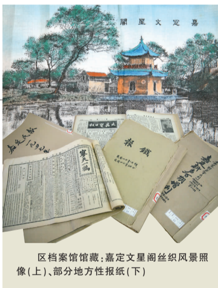
区档案馆馆藏：嘉定文星阁丝织风景照像(上)、部分地方性报纸(下)