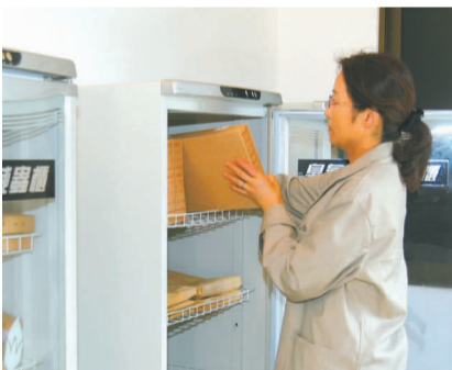
毒处理 工作人员在对进馆档案进行消毒