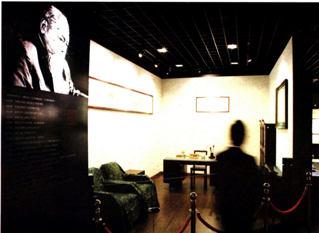
胡厥文生平事迹展览

胡光墉从来都热心承担家乡的建设事业。在负责疏浚嘉定东北乡的河道时，恰逢当年粮食欠收，百姓有饥馑之忧。胡光墉提出以工代赈的方案，不但起到了救灾的作用，而且保证了工程的进度。不仅如此，他还深入现场指挥调度，与百姓一起参加劳动。“其浚北横(泖)，车伤肩；浚新泾，以吻咯血。”即便身体如此，他依然赴事勤勉、白不言疲。对此事，胡厥文晚年仍然记忆犹新：“在疏浚河道期间，我常常天不亮就起床，跟着父亲上工地，父亲劳累以致咯血的情景深深地留在我的记忆里。”