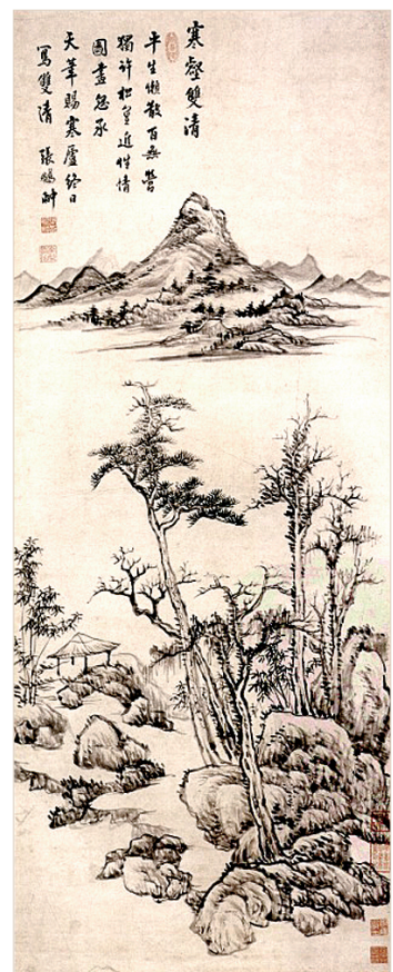
寒窗双清 张鹏翮/绘