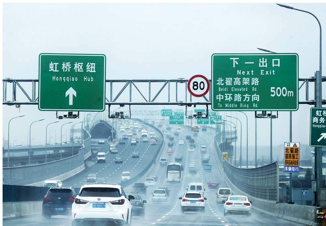
嘉定到虹桥综合交通枢纽的车程被缩短至15分钟