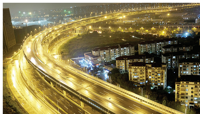
夜色中的嘉闵高架