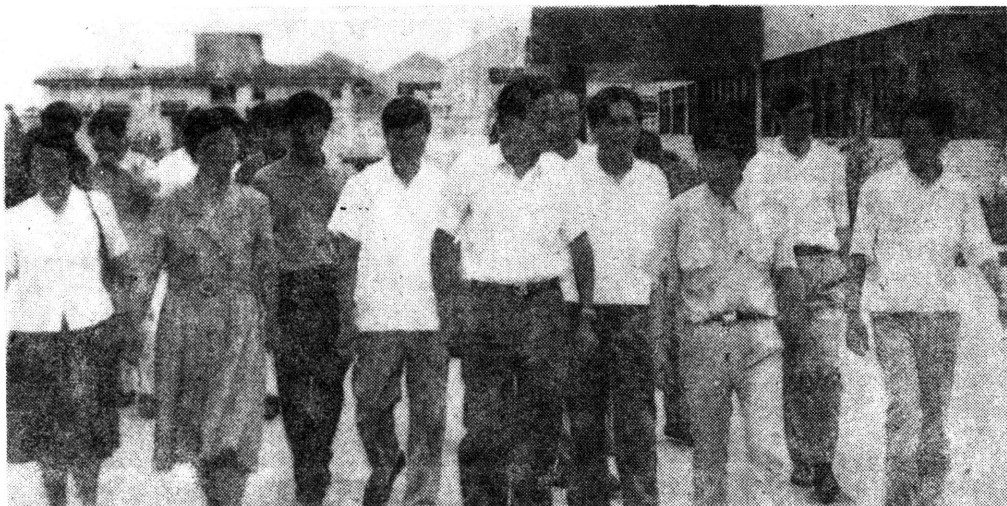
国务院副总理吴邦国(原中共上海市委书记)在区委副书记陆象娟、公司总经理周利明的陪同下,视察了上海育升童车制造有限公司。