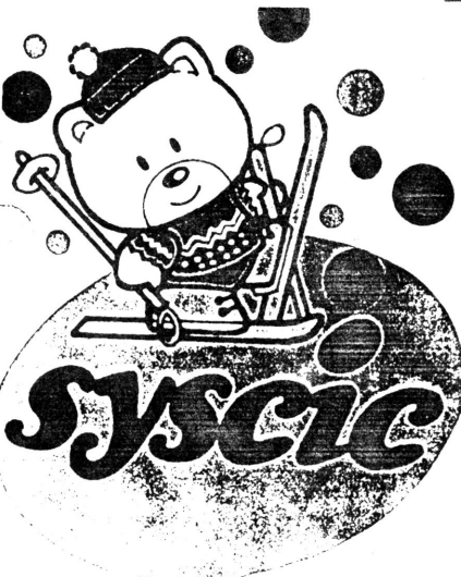
图为该公司的注册商标“熊宝宝”。