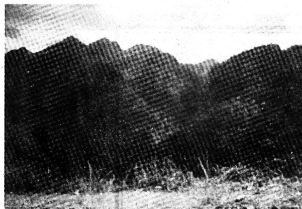
井冈山五指峰

□舒点 小说未写成，原有的直销网络已是网破线断，且又有其他直销公司的人员纷纷上门，乘机劝说我改换门庭，投