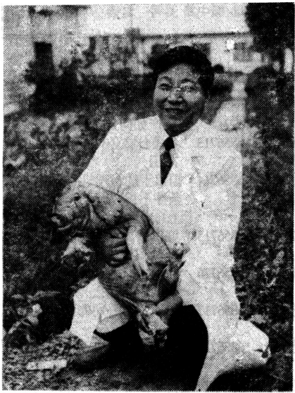
瞧,印南昌抱着梅山猪时多高兴。