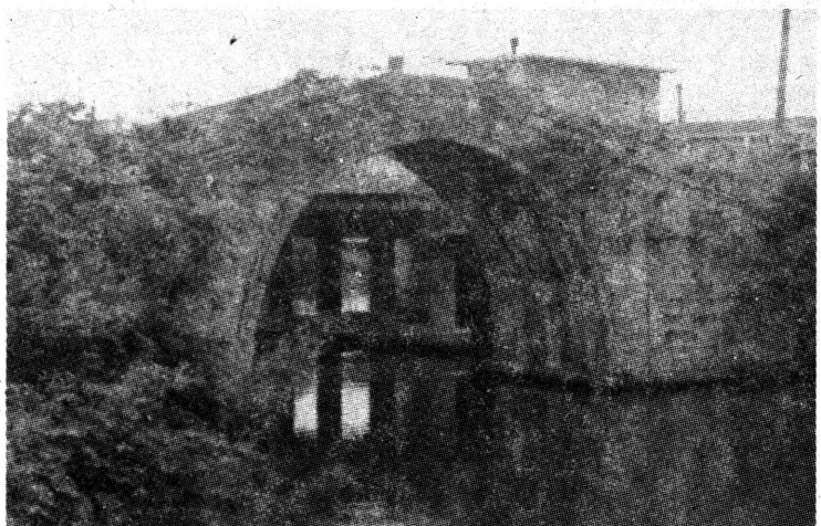
▲嘉定现存古桥有高义桥、众善桥、太平永安桥、登龙桥等近20座。图为跨练祁塘的单拱石桥高义桥。