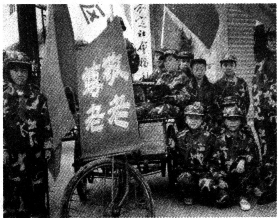
“小军人”经常走出校门参加社会活动。

素质教育的一项重要工作，为此，我们通过军校这一突破口做了不少努力，并取得了一定成效。今后，我们还将就此作进一步的实践与探索。