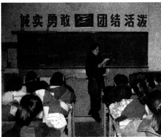
学校经常开展青年教师教学比武活动。

在实施素质教育实践过程中，我校以行为规范教育训练为抓手，开展了“养成教育”的探索，提高了学生的思想水平，形成了勤奋、进取、求实、创新的校风。1992年学校被授予上海市首批行为规范示范校荣誉称号。