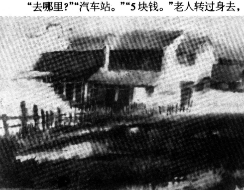
雨后斜阳(水彩画) 顾安国

经过一番折腾人的胃镜检查后，我疲惫地走出医院大门。迎面一辆出租车司机含笑招呼，并殷勤地为我打开车门。我平时坐车常晕，此时更觉艳阳下那火红“夏利”如怪物一般，便忙不迭地婉拒，道谢。这时，一辆三轮车从身后驶来，我赶紧拦住了车。一顶草帽遮住了骑车老人大半脸，一件洗得很薄的旧衬衣挂在他那衣架般瘦削的身上，黑色裤管挽至小腿，露出半旧军绿跑鞋的脚腕上没见袜子。 “去哪里？”“汽车站。”“5块钱。”老人转过身去，