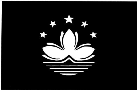
澳门特别行政区区旗

澳门特别行政区旗是一面中间绘有五星、莲花、大桥、海水图案的绿色旗帜。澳门是祖国不可分割的一部分,五星象征国家的统一;莲花深为澳门居民喜爱,它在五星照耀下含苞欲放,喻意澳门将来兴旺发达,莲花的三个花瓣表示组成澳门的三个岛屿;大桥和海水反映的是澳门自然环境的特点。