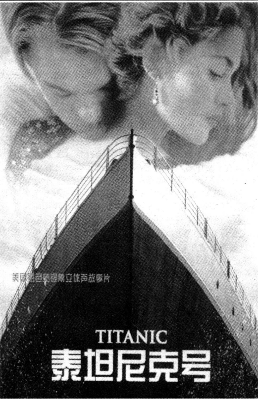
美国彩色宽银幕立体声故事片

电影本身散发出的迷人魅力，再添上媒体的大力炒作，使影片急速“疯”靡全球，荣登电影史上票房最高的宝座。两位清纯的青年演员也人气剧升，成为全世界影迷追捧的明星。同时，影片的音乐似天籁之音，很好地映衬出了浪漫唯美、荡气回肠的氛围，其电影原声带也被列为不能不珍藏的电影音乐经典。