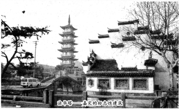
法华塔——嘉定的标志性建筑

历史价值,而不是商业价值,所以最好以原地保护为主,不要搬迁保护。州桥老桥政府下决心搞,老百姓也蛮高兴,争论得也蛮多,我认为立足点并不是搞商业、搞发展,而是要下本钱,逐步把它改造好。嘉定几座桥是好的,路再跟上去,种点绿化,环境就优雅了许多。人走走,就很舒服,走的人多了,就自然成气候了,倒不要非要造房子、搞商业。