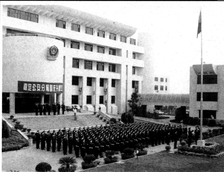
图片新闻 10 月 1 日上午,嘉定公安分局 300 多名身着新式制服的民警,面对鲜艳的五星红旗,在分局大楼广场上举行了庄严的升旗仪式。

据悉,伟邦服饰、银唱碟、清河面包房、隆顺米线馆已完成店面整治,整治后的商店面貌焕然一新,亮丽的面貌透出清河路浓浓的商业气息。(沈逸)