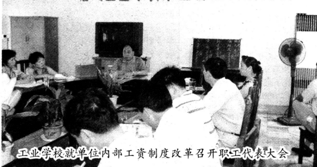
工业学校就单位内部工资制度改革召开职工代表大会