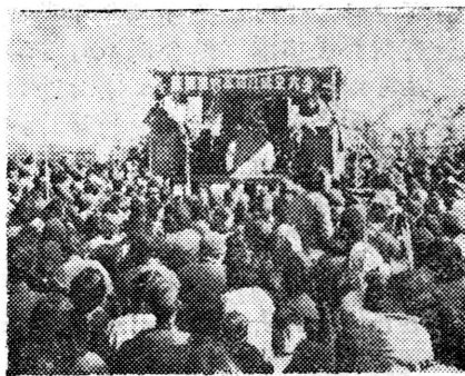
馬陸鄉裕農高級社成立

今日來自各区的青年們在嘉定舉行文藝大會演。准备演到明日結束。这次上演的劇目, 都是各区在春節會演中挑選出來的精悍節目, 形式丰富多采, 有小型戲劇、說唱、歌舞、田山歌、蕩湖船、“蚌壳精”、十里亭。民間創作“平升三級”、“廣播喇叭”等28个。为鼓勵創作和推动今后羣众文藝活动, 會演后要進行評獎。