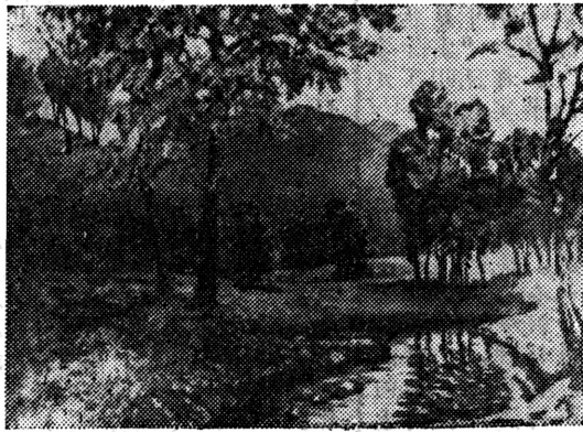
金陵之秋（油畫）·李立五畫

地区的局勢目前非常緊張。叙利亞人民反對帝國主義的侵略和維護他們的獨立的斗争，得到了全世界愛好和平人民的廣泛支持。苏联政府聲明，苏联准备派自己的武裝部隊參加鎮壓侵略和懲罰和平破壞者。我們六億中國人民完全支持叙利亞政府和人民維護民族獨立、反抗侵略的正义立場。毛主席已經致電叙利亞總統，表示堅決支持叙利亞人民的正义斗争。中國人民將以一切力量支援叙利亞人民抵抗侵略。德意志民主共和國、沙特阿拉伯、黎巴嫩、摩洛哥等國也都表示全力支持叙利亞。