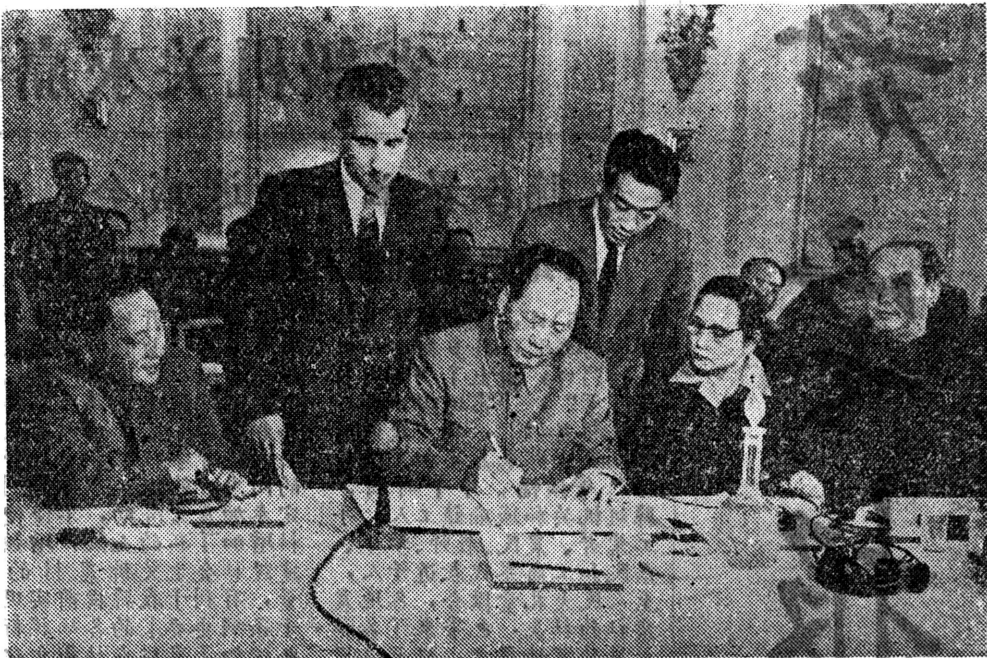
1957年11月14日至16日在莫斯科召開了社會主義國家共產黨和工人黨代表會議。會議一致通過了社會主義國家共產黨和工人黨宣言。圖為毛澤東主席在社會主義國家共產黨和工人黨宣言上簽字。

西班牙、意大利、加拿大、中國、哥倫比亞、朝鮮、哥斯達黎加、古巴、盧森堡、馬來西亞、摩洛哥、墨西哥、蒙古人民共和國、荷蘭、新西蘭、挪威、巴拿馬、巴拉圭、秘魯、波蘭、葡萄牙、羅馬尼亞、聖馬力諾、敘利亞和黎巴嫩、蘇聯、泰國、突尼斯、土耳其、烏拉圭、芬蘭、法國、錫蘭、捷克斯洛伐克、智利、瑞士、瑞典、厄瓜多爾、南斯拉夫、日本。會議參加者就當前國際局勢中的迫切問題交換了意見，並通過了向各國工人和農民、向全世界的男女們、向一切善良的人們發出和平宣言。